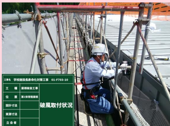
第一体育館 破風板取付