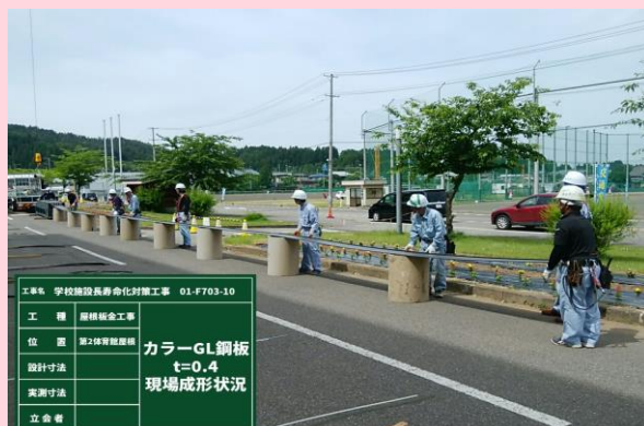
第二体育館 屋根材現場成形