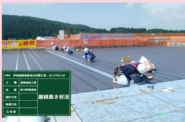
第一体育館 屋根葺き