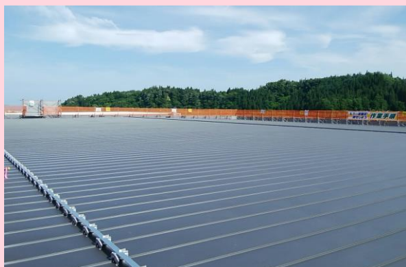
第一体育館 屋根葺き完了