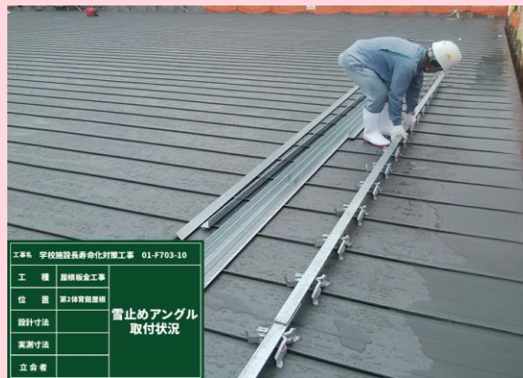
第二体育館 雪止め取付状況