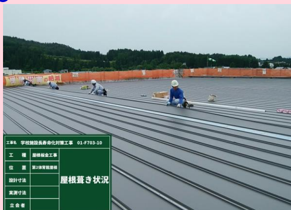
第二体育館 屋根葺き状況