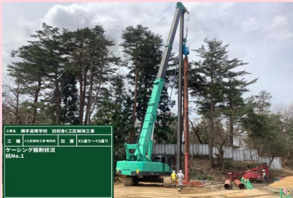
既存杭引抜き 掘削状況