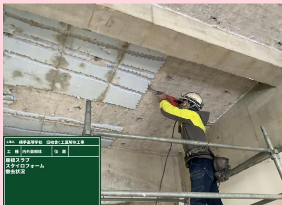
屋根スラブ スタイロフォーム撤去状況