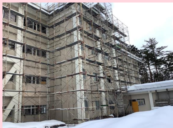
外部足場設置状況