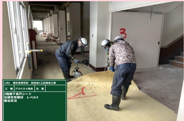
石綿含有建材(レベル3) 解体状況