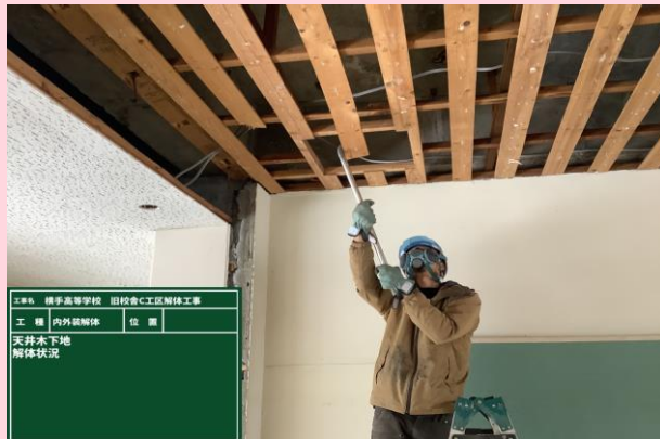
天井木下地解体状況