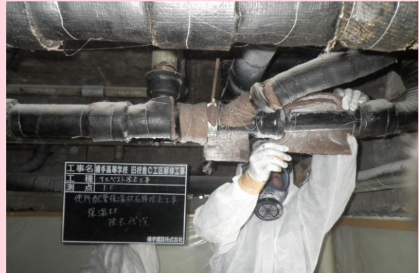
石綿レベル2 配管保温材除去