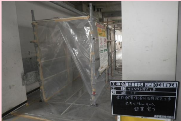
石綿除去作業 セキュリティルーム設置