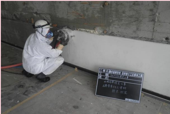
石綿レベル3 内部吹付塗材除去