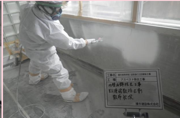
石綿除去後 粉塵飛散防止剤散布