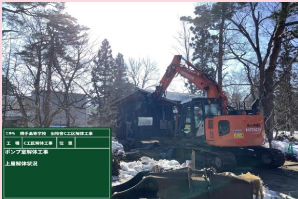
ポンプ室 上屋解体状況