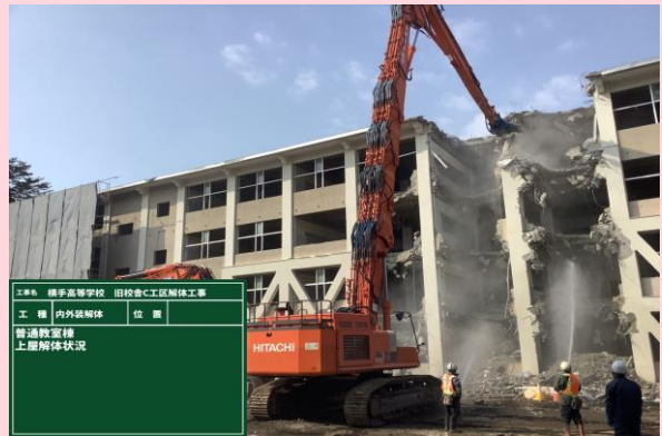
普通教室棟 上屋解体状況