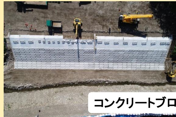
コンクリートブロック